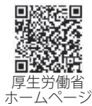
厚生労働省ホームページ