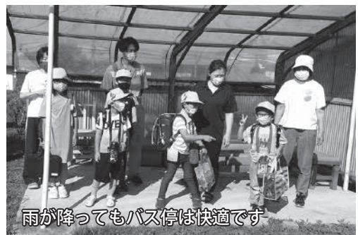
雨が降ってもバス停は快適です