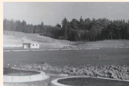
テニスコート整備（昭和60年）