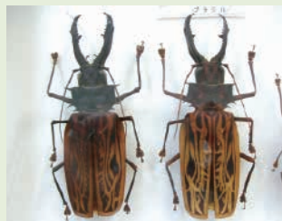
【オオキバウスバカミキリ】

世界最大のセミ。体長が7～8cm、翅を広げた大きさは18～21cmほどになる。まさにセミ界の帝王。