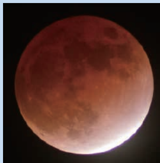
2021年11月の部分月食（天文館）

その皆既月食が11月8日⑩に見られます。午後6時10分頃から暗くなり始め、午後7時17分頃には月の全てが隠されます。今回は、皆既食の状態が約1時間30分も続きます。また、東の空の高い位置で始まりますので、始めから終わりまで十分に楽しむことができます。さらに、午後8時40分過ぎには月食中の月と天王星が重なり、天王星が見えなくなるという天王星食が起こります。青緑色の天王星が赤銅色の月に隠される神秘的なシーンも見逃せません。天文館では8日午後6時から月食観望会を開催します。ぜひご参加ください。