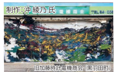
旧加藤時計電機商会(黒羽田町)

シャッターアートは那珂川を泳ぐ鮎の群れが力強く描かれています。彫刻は木に無数の穴を開けて木漏れ日を表現しています。