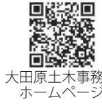
大田原土木事務所ホームページ