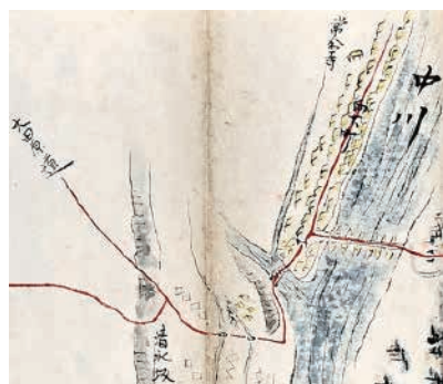
▲大田原道との分岐点。ちなみに中川（那珂川）には、船橋が架かっています。（「黒羽道中図画」より）

具体的ルートは、「黒羽道中図画」（黒羽芭蕉の館所蔵）という資料に赤線で描かれています。それによると、喜連川宿の北方（現、さくら市南和田付近）で奥州道中と分岐し、小郷野・福原・新宿・折橋（倉骨）・中ノ平（湯津上）を通り、清水坂（大豆田）を下って大田原道（大田原と黒羽を結ぶ道）と合流しました。現在の、県道167号線（小郷野・福原・蛭田）と、市道（蛭田交差点から那須野ヶ原カントリークラブと株式会社ヒラノ大田原農場二見牧場の間を通ってスーパーダイユー黒羽店付近で国道461号に合流する道）に近いルートであったと考えられます。遺構はほとんどありませんが、福原郵便局周辺に柵形（クランク）が遺っています。