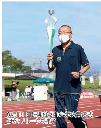
9月11日に開催された炬火集火式(炬火リレー)の様子

「夢を感動へ。感動を未来へ。」のスローガンの下、第77回国民体育大会「いちご一会とちぎ国体」が10月1日から11日まで、「いちご一会とちぎ大会」が10月29日から31日まで開催されます。