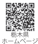
栃木県ホームページ

※請求書や添付書類(診断書・領収書)の様式は、厚生労働省のホームページに掲載しているほか、県のホームページや窓口などでも入手できます。請求期限は、平成31年4月24日(法律の施行日)から5年以内です。