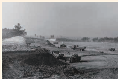
陸上競技場造成工事（昭和60年）