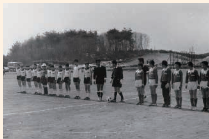
多目的運動広場仮オープン親善サッカー試合 黒羽小対川西小（昭和59年3月30日）